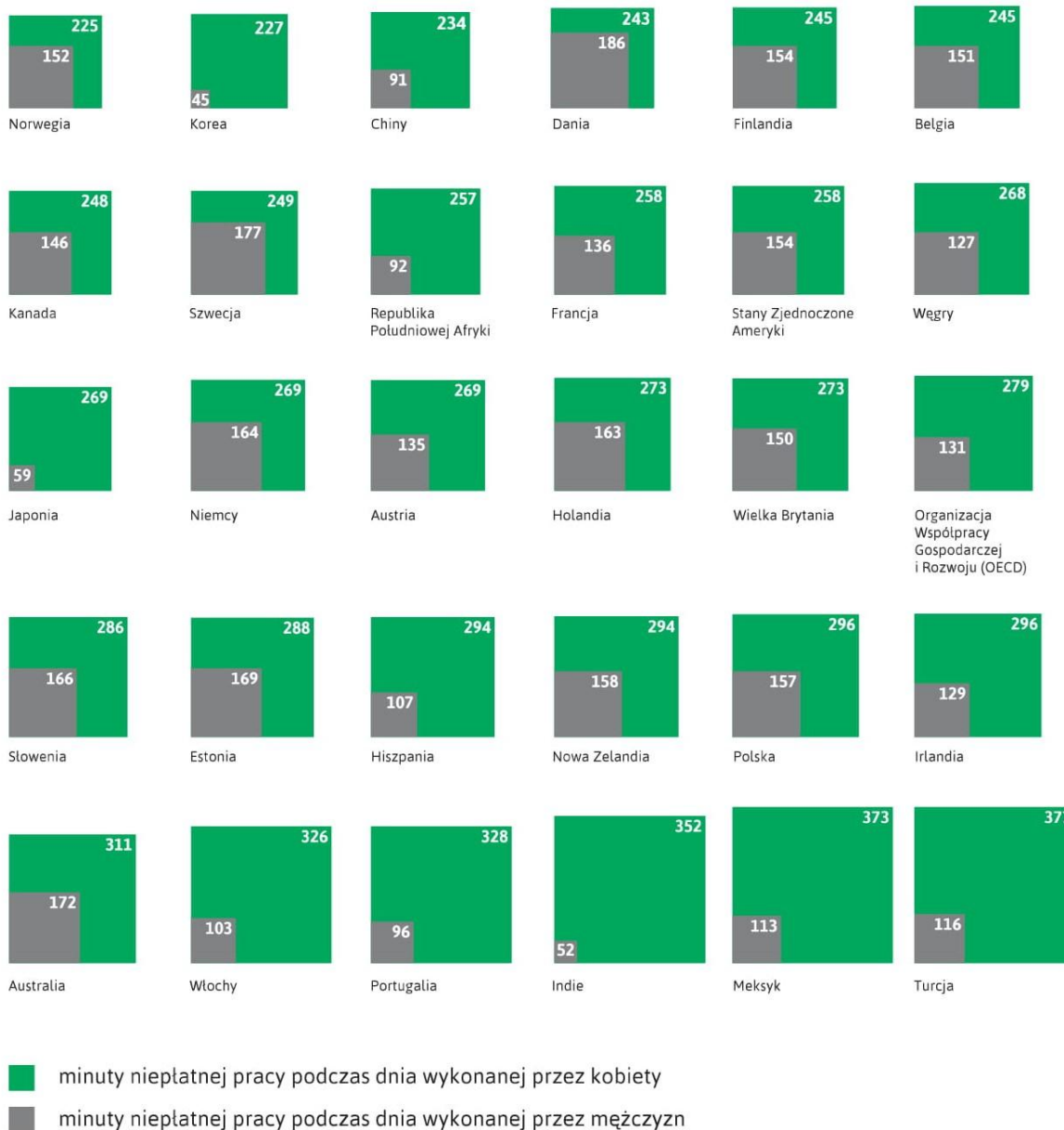
Diagram pokazujący różnice w ilości wykonywanej pracy niepłatnej przez kobiety i mężczyzn w wybranych krajach

„Niepłatna praca” w definicji Organizacji Współpracy Gospodarczej i Rozwoju (OECD) to produkcja dóbr lub wykonywanie usług przez członków rodziny, za które mogliby, ale nie otrzymują zapłaty na rynku. Zasada: Osoba wykonuje niepłatną pracę, jeśli wykonuje zadanie, które mogłoby być zlecone za wynagrodzenie komuś spoza rodziny. Do takich zadań zaliczają się: gotowanie, uprawa przydomowego ogrodu, mycie i czyszczenie, opieka nad dziećmi, pranie, wyprowadzanie psa, naprawa samochodu itp. Nie należy mylić niepłatnej pracy z takimi czynnościami jak rozrywka, np. oglądanie filmów, uprawianie sportu, czytanie książki itp.