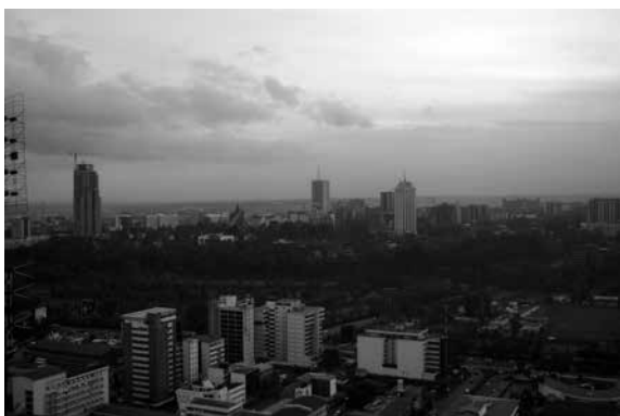
Fot. 2. Hanna Habera.