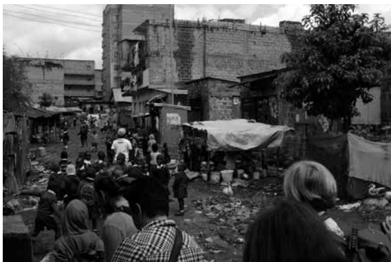
Fot. 3. Hama Habera.