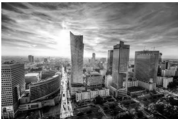
Fot. 4.