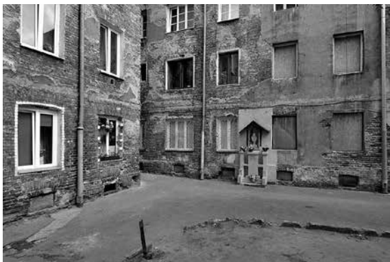
Fot. 5.